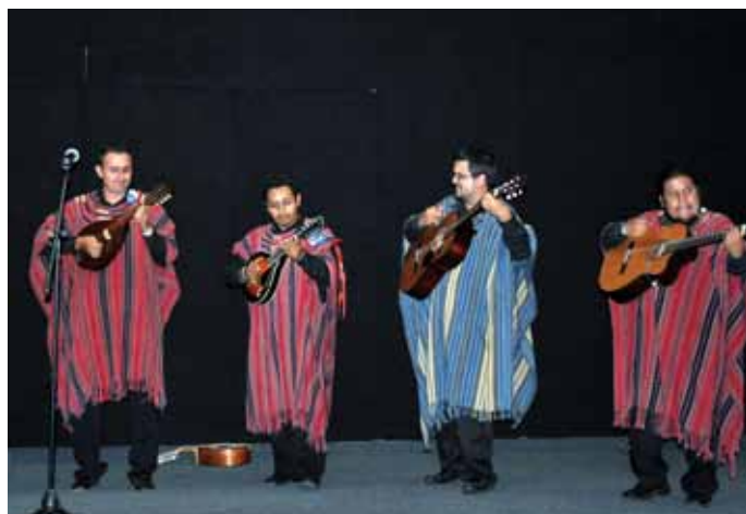
El grupo guatemalteco mantiene fuertes vínculos con la Estudiantina de nuestra Facultad.