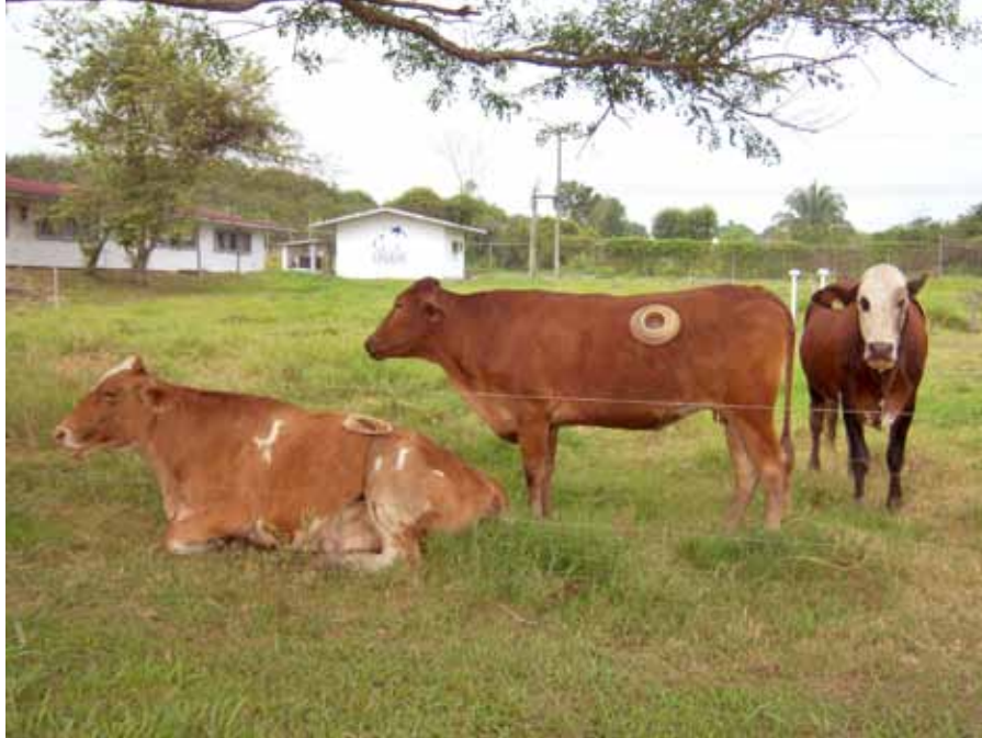
“Rumenotomía en bovinos del CEIEGT”. Autor: Irely Ledesma Ramírez.

La foto que en esta ocasión ganó un espacio en Infovet se titula “Rumenotomía en bovinos del CEIEGT”. La autora es Irely Ledesma Ramírez, quien la envió desde el Centro de Enseñanza, Investigación y Extensión en Ganadería Tropical, con el objeto de mostrarnos parte del trabajo que ahí se realiza.