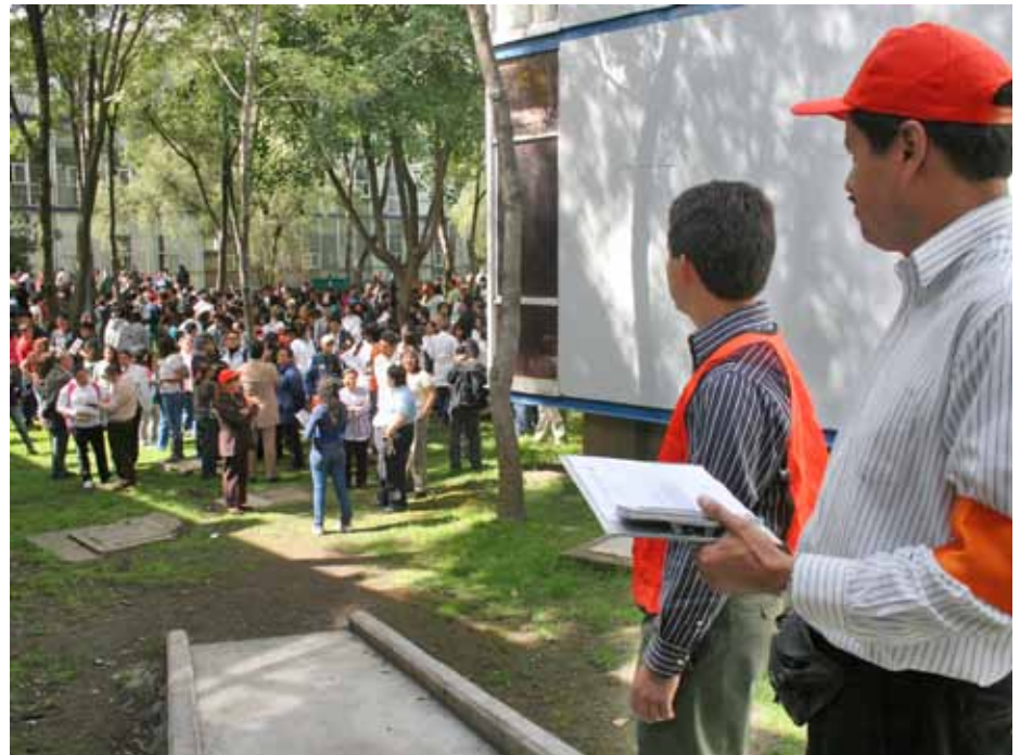
Entre los edificios dos y tres se instauró un nuevo punto de reunión; para acceder a éste fue necesario construir una rampa.

En ambos turnos, académicos, alumnos, trabajadores administrativos e incluso las personas que visitan nuestra Facultad respondieron entusiastamente al sonido de la alarma y atendieron respetuosamente las indicaciones de los miembros de la CLS, de los Jefes de Edificio y de los Brigadistas, quienes se encargaron de coordinar el desalojo de los edificios, de dirigir a las personas a los puntos de reunión (zonas de seguridad), de registrar el tiempo de desalojo en cada edificio, de efectuar el conteo del total de personas evacuadas y de revisar las instalaciones, entre otras acciones.