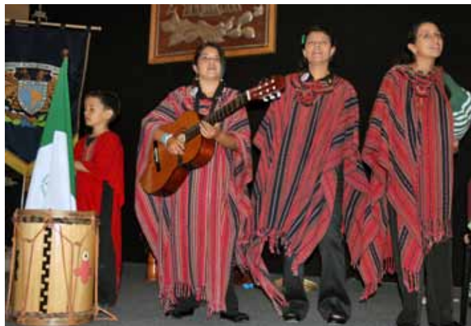
La Estudiantina de la FMVZ de la Universidad San Carlos de Guatemala, la invitada de honor.