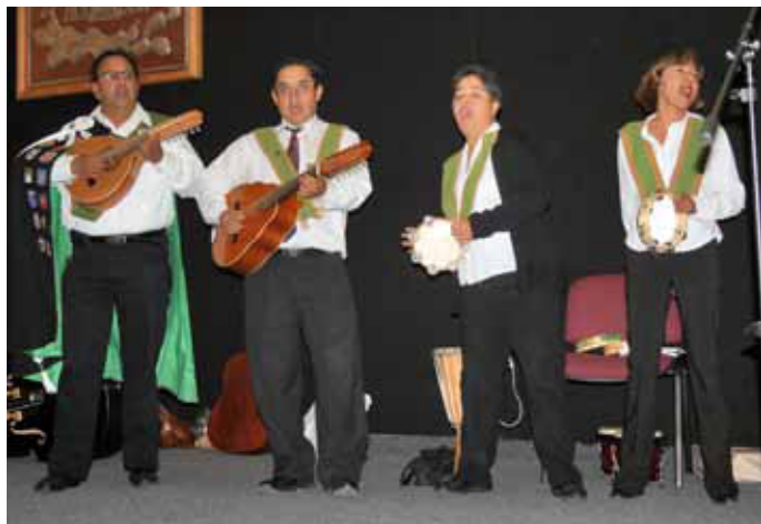
En la celebración estuvo presente el grupo Fundadores de la Estudiantina de Veterinaria.