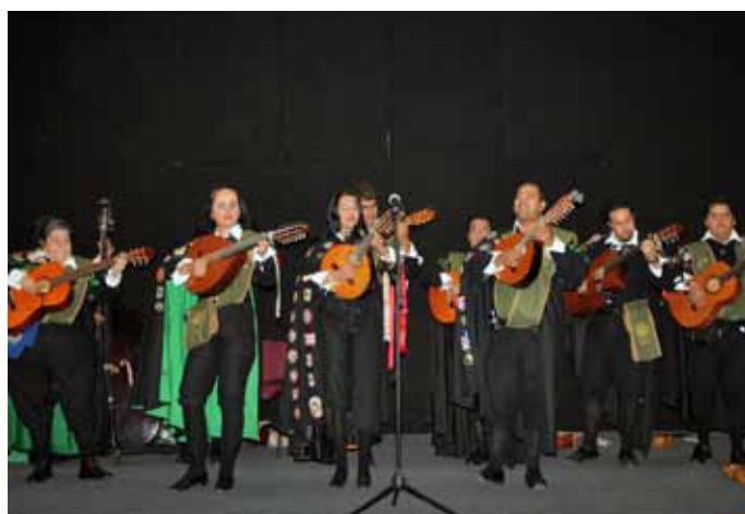
Los festejados interpretaron las canciones preferidas de su público.

ESTE 2010, la Estudiantina de nuestra Facultad cumple 25 años de existencia y para celebrarlos organizó el Encuentro Internacional de Estudiantinas, en el que participaron como invitados de honor la Estudiantina de la Facultad de Medicina Veterinaria y Zootecnia de la Universidad San Carlos de Guatemala, así como los Fundadores de la Estudiantina de Veterinaria de la UNAM.