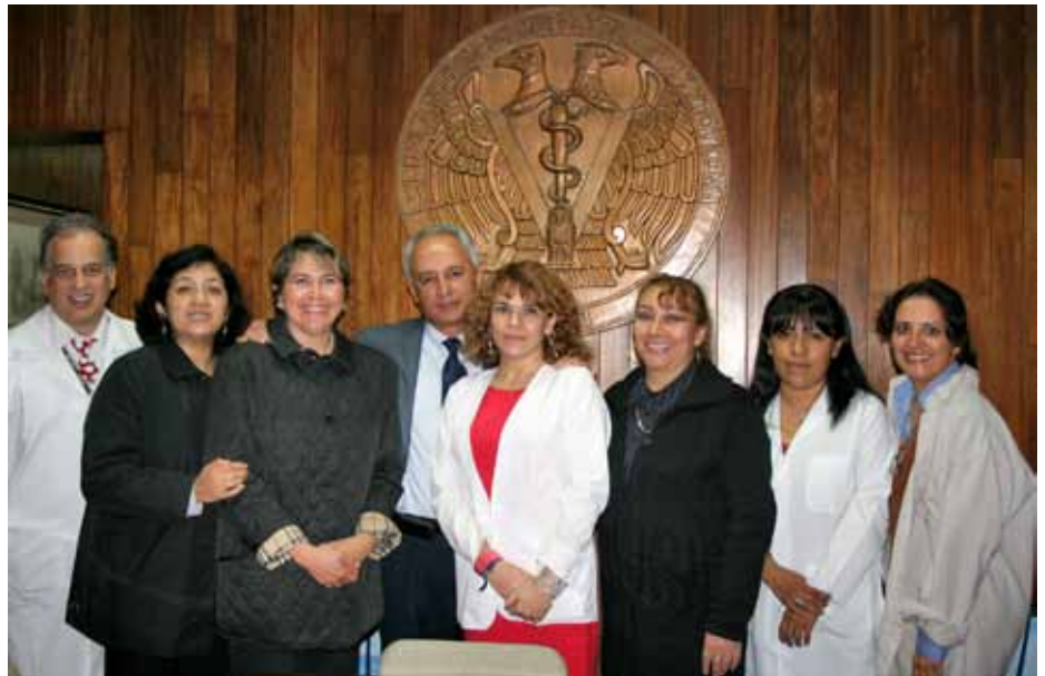
En la quinta edición del libro participaron, como autores, profesores de diversas instituciones de enseñanza de MVZ del país y del extranjero. En la imagen vemos a parte de los autores.