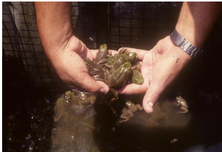
Especímenes de ranas toro.

Contando con instalaciones básicas, las ranas se trajeron y sembraron, obteniéndose renacuajos mismos que se cultivaron. En los estanques del ranario se colocaban lámparas para atraer insectos por las noches y con ellos se alimentaran las ranas; también, como alimento se les proporcionaba crías de tilapias.