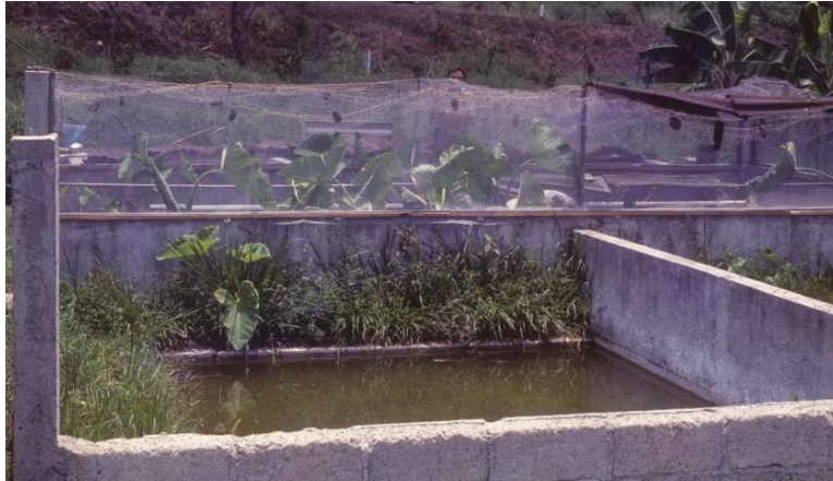
Estanques para la producción de rana toro.

Contando con instalaciones básicas, las ranas se trajeron y sembraron, obteniéndose renacuajos mismos que se cultivaron. En los estanques del ranario se colocaban lámparas para atraer insectos por las noches y con ellos se alimentaran las ranas; también, como alimento se les proporcionaba crías de tilapias.