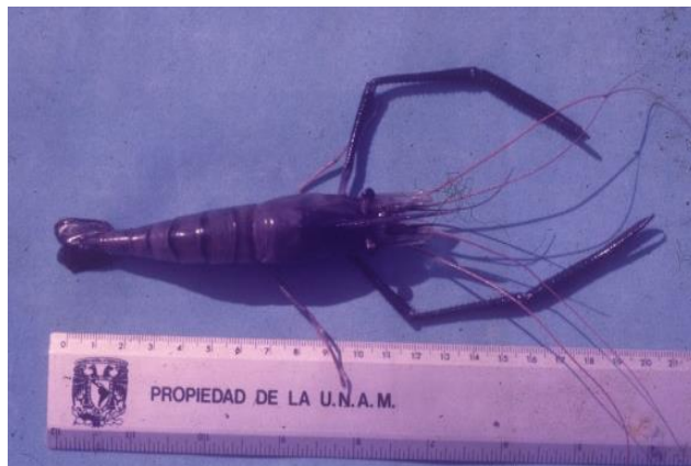
Langostino malásico, 1988.

El proyecto del cultivo de langostinos malásico se originó por la propiedad de las tilapias de poder producirse como policultivos o cultivos mixtos; y, de esta característica, surgió el proyecto de su cultivo en combinación con langostino malásico. La población de langostinos provino del Laboratorio Acuanatura ubicado en Casitas, Tecolutla.