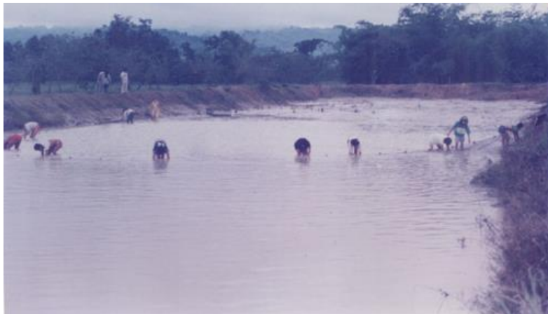
Cosecha de langostino malásico con red de arrastre en estanque rústico.