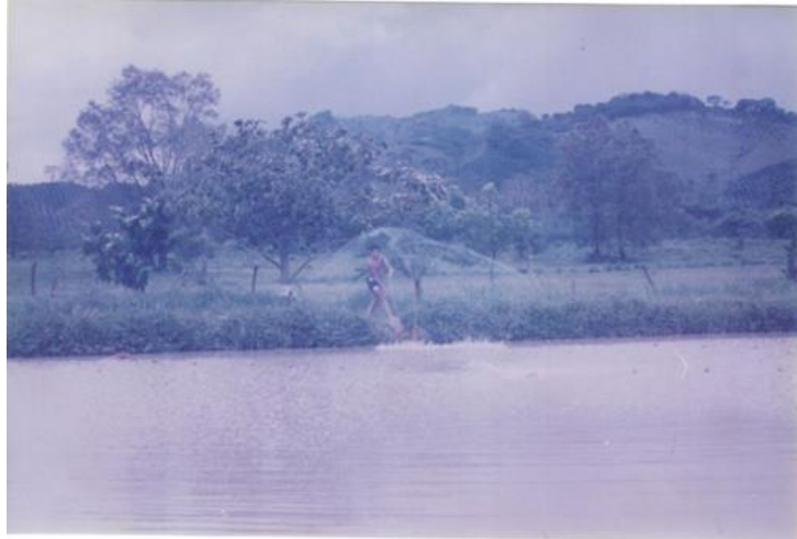
Cosecha de tilapias con atarraya en estanque rústico.

La cantidad producida no pudo ser estimada exactamente porque se descubrió que personas ajenas al Centro llegaban al estanque para robar. Los langostinos cosechados se vendieron entre el personal del CIEEGT.