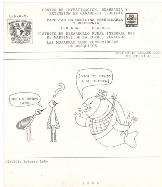
Tríptico No. X. Las mojaras como consumidoras de mosquitos.