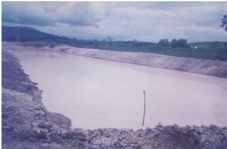
Estanque rústico en construcción, 1988.