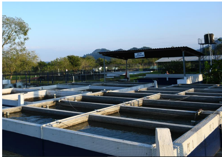
Estanques del área de desarrollo de pie de cría.

Para realizar los trabajos rutinarios, guardar insumos y materiales piscícolas se contaba con una pequeña área techada pero abierta (conocida como el tejabán). Otros materiales o equipos delicados se resguardaban en la oficina 101, ubicada en la parte baja del Albergue II, misma que durante los primeros años fungió como bodega y laboratorio del personal de Acuicultura.