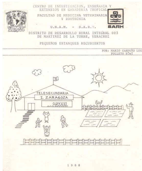
Tríptico No. VI. Pequeños estanques recubiertos.