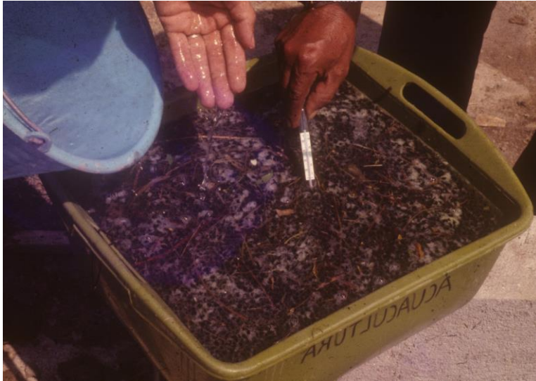
Huevos de rana toro obtenidos de estado silvestre.

“Otros especímenes de rana se obtuvieron de embalses de agua de la región, de ollas de agua que captaban agua de lluvia. Para ello, se organizaban salidas para encontrar huevos de rana toro que eran fácilmente reconocibles por ser una masa de huevos, se recolectaban y se traían; de esos nacieron muchísimos, y de allí se seleccionaron para reproductores” (Germán Muñoz Córdova, 2023).