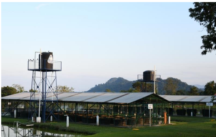
Instalaciones del área de crianza.

Por concurso, como proyecto de investigación, se obtuvo otro financiamiento de Fondos Mixtos de CONACYT en conjunto con el gobierno del estado de Veracruz. Con ese recurso se construyó otra nave de crianza; cada nave se proyectaba con su propio tanque elevado para suministro de agua.