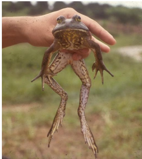
Ejemplar de rana toro ( Rana catesbeiana ) del CIEEGT.