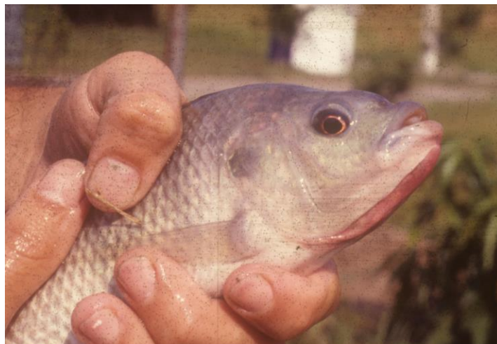
Tilapia gris del Nilo ( Oreochromis niloticus ).

Con base en los resultados obtenidos de los proyectos de policultivo y de rana toro realizados por el área de acuicultura, se decidió que todos los estanques se destinarían para la investigación y producción de tilapias.