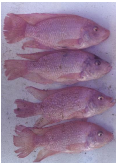
Especímenes de la población original de Tilapia Roja de Florida, 1982.

Mayoritariamente, la población original de Tilapia Roja de Florida era color rosa aunque también había de color gris en todo el cuerpo. A la postre, la primera se seleccionó hacia color rojo y la de color gris se eliminó, porque tenían pobre desempeño productivo, bajas ganancias de peso y pobre crecimiento; esos peces tardaban 8 o 9 meses para alcanzar la talla comercial, lo que no era interesante para ningún productor. Los rojos eran llamativos a la vista, pero tampoco eran muy productivos. Posteriormente, surgió la idea de investigar para obtener animales de color rojo pero con mejor rendimiento productivo.