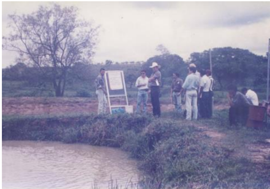
Productores atendiendo a un curso en el CIEEGT.

Con la finalidad de llegar a más productores acuícolas, en los primeros años, las acciones de la Sección de Acuicultura se enfocaron al extensionismo, dedicando tiempo y recursos para esta actividad.