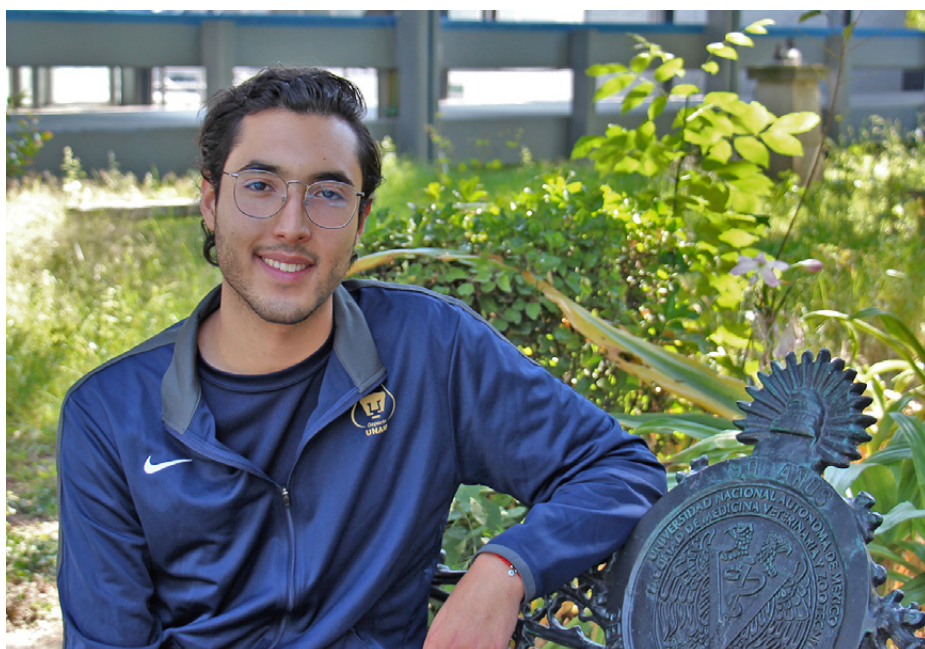
El joven es un apasionado del bádminton y de la MVZ.

Por otro lado, en una entrevista concedida a Infovet en 2021, año en el que recibió el Premio Universitario del Deporte en el rubro de mejor alumno