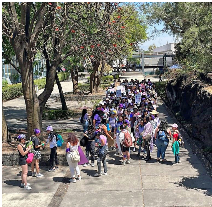
El Quijote, punto de reunión para la colectiva de la FMVZ que participó en la marcha por el Día Internacional de la Mujer

En el comunicado se agrega que desde 2020, cada 9 de marzo (9M) las mujeres universitarias efectúan “un paro de actividades a nivel nacional” para hacer visible el impacto que tiene su ausencia en el “desarrollo de la sociedad en su conjunto, tanto en el ámbito remunerado como en el no remunerado”.