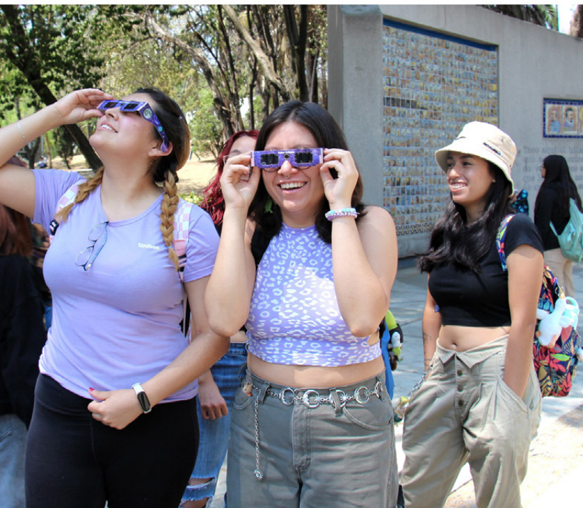
El pasado 8 de abril, la comunidad de la FMVZ contempló el eclipse de forma segura, utilizando métodos indirectos. Página 7.