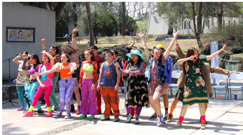
La obra fue creada por la Generación 2021 del CUT.

Creada por la Generación 2021 del Centro Universitario de Teatro (CUT), en colaboración con el Grupo Galpão, por lo que se considera también una co-