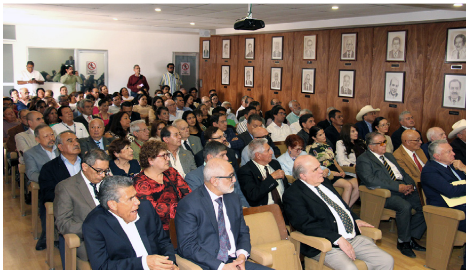
En el auditorio.