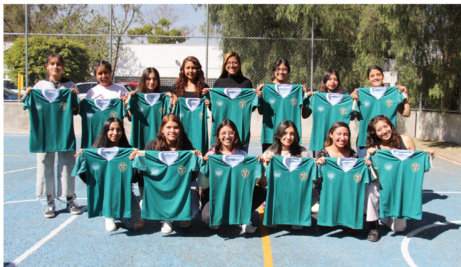
El equipo de fútbol femenino de la FMVZ fue objeto de reconocimiento especial, pues ha jugado 16 finales consecutivas.

Información, redacción y fotos: Virginia Galván Pintor.