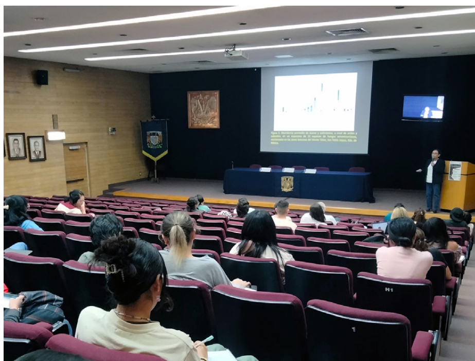
El auditorio Pablo Zierold Reyes, lugar del encuentro presencial.

La reunión incluyó una mesa redonda sobre el estado actual de la acarología en México, en la cual se hizo hincapié en la importancia de las colecciones científicas nacionales, regionales y de referencia, la obtención