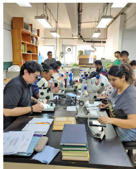
En uno de los talleres de la prereunión.

Fue el auditorio Pablo Zierold Reyes el lugar del encuentro, en el cual se dijo que otros de los propósitos de este fueron crear redes de comunicación y colaboración entre quienes llevan a cabo investigación, contar con