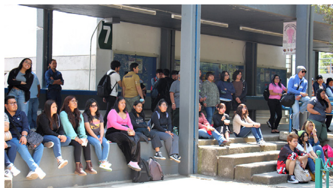
El público en la explanada de El Quijote.

Redacción y fotos: Virginia Galván Pintor.