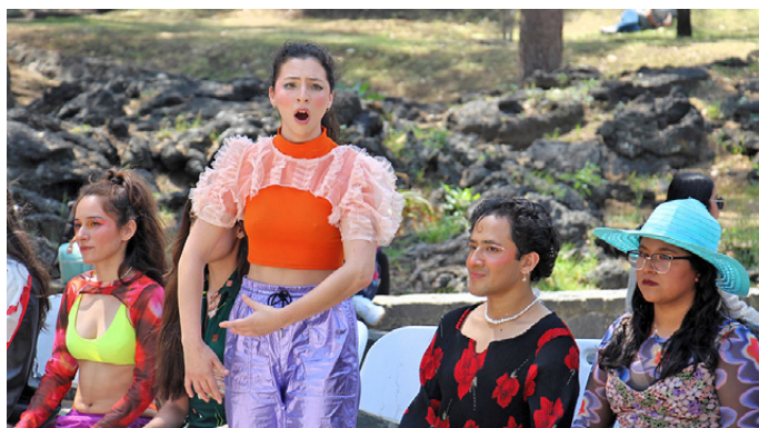
Además de actuación, en la obra hubo canto, coreografías y música.

producción México-Brasil, Gente logró reunir, en la explanada de El Quijote, a estudiantes, personal académico y administrativo, autoridades y personas externas, quienes tuvieron la oportunidad de ver y aplaudir las actuaciones de cerca de 20 jóvenes, algunos de los cuales mostraron sus grandes dotes para el canto.